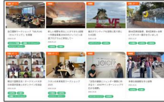
インタビュー記事、実施レポートなどを掲載