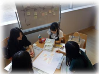
PBL実施後の 事後学習の一コマ