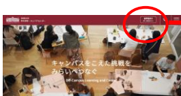
学外学修・キャリアセンターWebサイト

学外学修・キャリアセンターWebサイト、TsudaNetからアクセスできます。プログラム募集情報、学外学修の手続き、キャリア支援に関する情報を掲載しています。