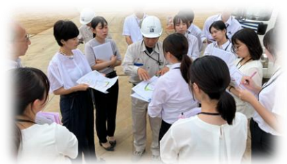
OGが経営する企業での インターンシップ