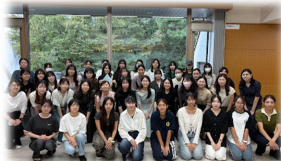
ワタシの未来発見ワークショップ で、OGの皆様と