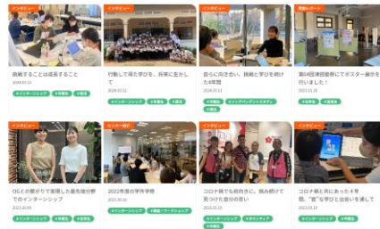
インタビュー記事、実施レポートなどを掲載