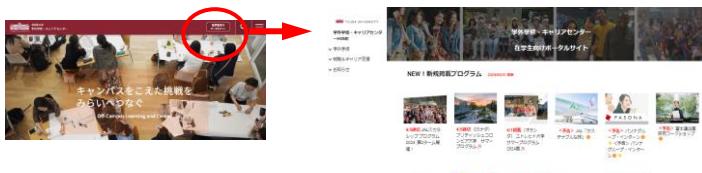
学外学修・キャリアセンター Webサイト

学外学修・キャリアセンターWebサイトからアクセスできます。プログラム情報、学外学修の手続き、最新情報を随時掲載しています。